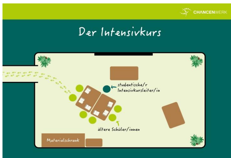
Abbildung 2: Darstellung des Intensivkurses

Die Intensivkurse finden in der Regel einmal pro Woche für je 90 Minuten statt. Hier erhalten die Jugendlichen Unterstützung in einem Fach ihrer Wahl . Gefördert werden sie von einem Studierenden. Diese* Intensivkursleiter*in fördert die Jugendlichen im vereinbarten Fach nach ihren individuellen Bedarfen.