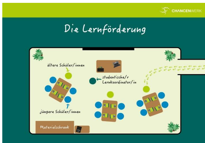
Abbildung 1: Darstellung der Lernförderung

Die Lernförderung findet in der Regel zweimal pro Woche für je 90 Minuten statt. Hier erhalten Kinder, d.h. jüngere Schüler*innen (meist der Jahrgangsstufen 5-8) Unterstützung bei ihren schulischen Aufgaben. Beim Lernen begleitet werden sie im Sinn der Peer-Education von Jugendlichen, d.h. älteren Schüler*innen (meist der Jahrgangsstufen 8-10), den sogenannten Tutor*innen . In jedem Raum übernimmt zusätzlich ein*e Übungsleiter*in die Aufsicht. Diese*r Lernkoordinator*in übernimmt die pädagogische Gestaltung der Lernförderung und begleitet insbesondere die Jugendlichen dabei, ihre jüngeren Mitschüler*innen beim Lernen fundiert zu unterstützen. Sie oder er sorgt für eine aktivierende und konzentrierte Arbeitsatmosphäre und wird im Bedarfsfall auch selbst unterstützend aktiv (s. Kapitel 4.3). Methoden für die Arbeit in der Lernförderung erlernen die Lernkoordinator*innen durch eine fundierte Einarbeitung und eine fortlaufende persönliche Begleitung.